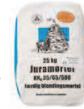
Mørtel Type 5 (IV)