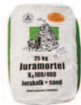
Mørtel Type 3 (III)