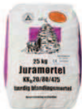
Mørtel Type 6 (VI)