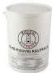
Kalktype 1 (K)

Denne smidige kalk hælder i luft og er en vigtig ingrediens i vores åbne mørtler