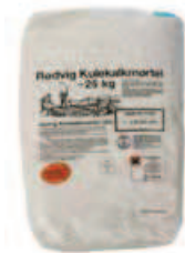
Mørtel Type 1 (I)